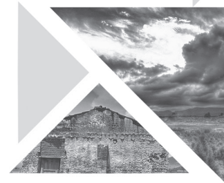
Detalles. Fotografía digital D/In. Artista de Jairo Martínez Domínguez.

Publicación del Centro de Investigación y Estudios Avanzados en Ciencias Políticas y Administración Pública, de la Universidad Autónoma del Estado de México.